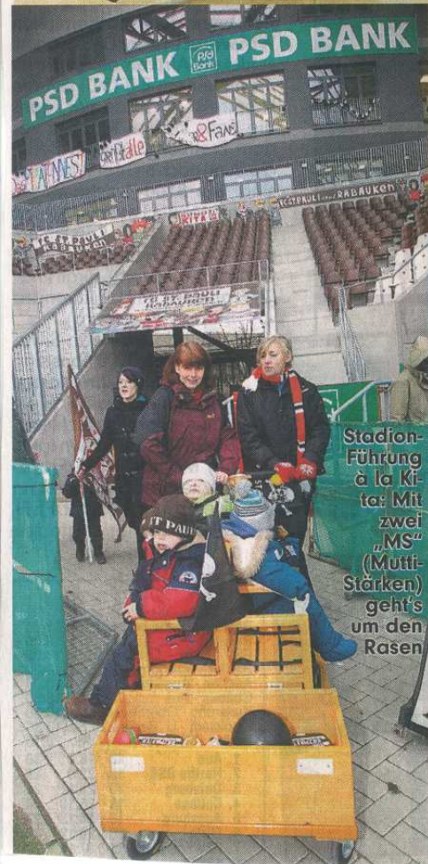
BILD-Besuch bei den Pauli-Rabauken