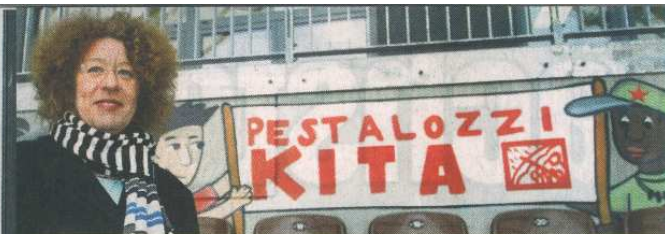
Hat einen Arbeitsplatz, um den sie viele Pauli-Fans beneiden: Kita-Leiterin Karin Hlawa