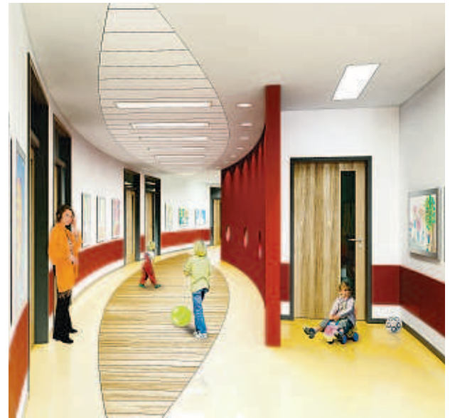
Ein Blick ins Innere der Kita. Bis zu 100 Kinder werden hier ab Mitte November betreut. Die rote Wand in der Mitte zieren Bullaugen, von den Räumen auf der rechten Seite schaut man ins Stadion.